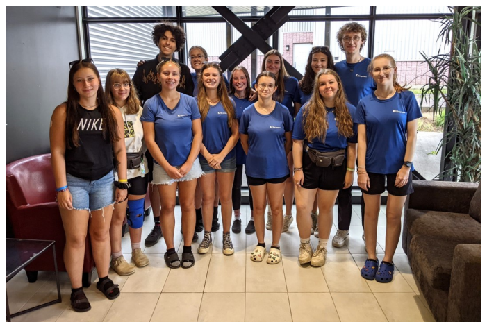
Photo : À l'avant, de gauche à droite : Cactus, tournesol, kayak, libellule, Cherrios, vanille, blü