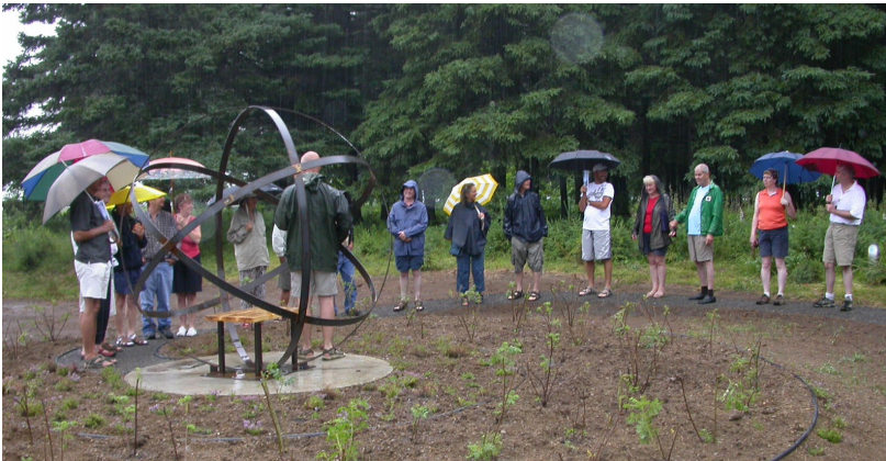
Dévoilement du Jardin de guérison, été 2007